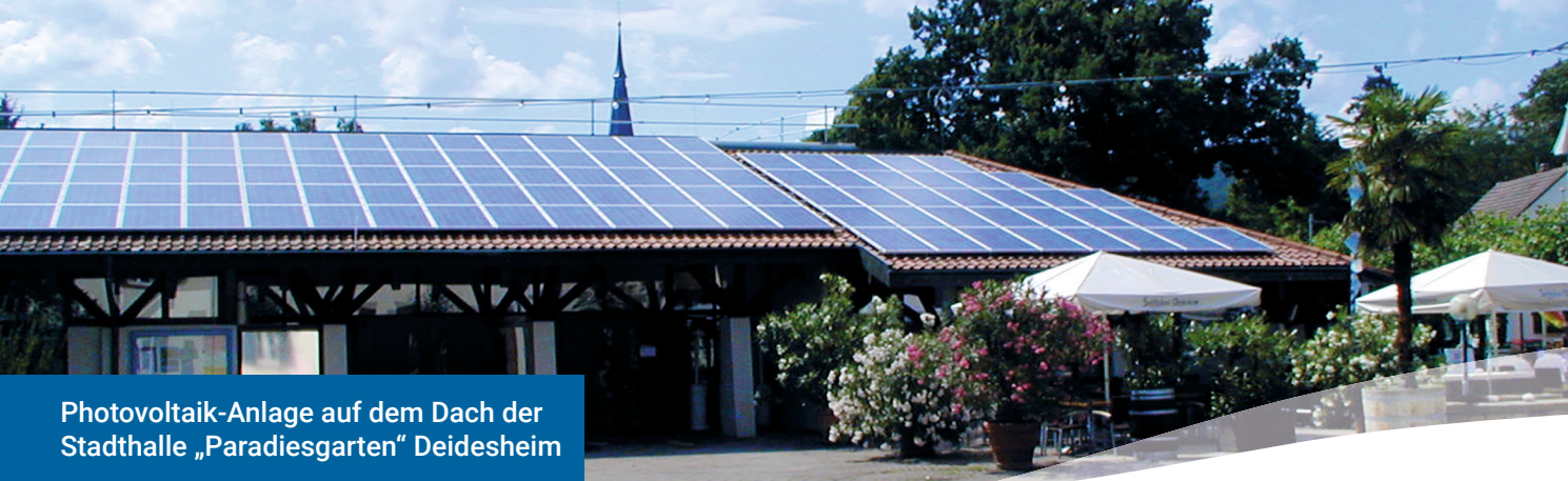
Photovoltaik-Anlage auf dem Dach der Stadthalle „Paradiesgarten“ Deidesheim